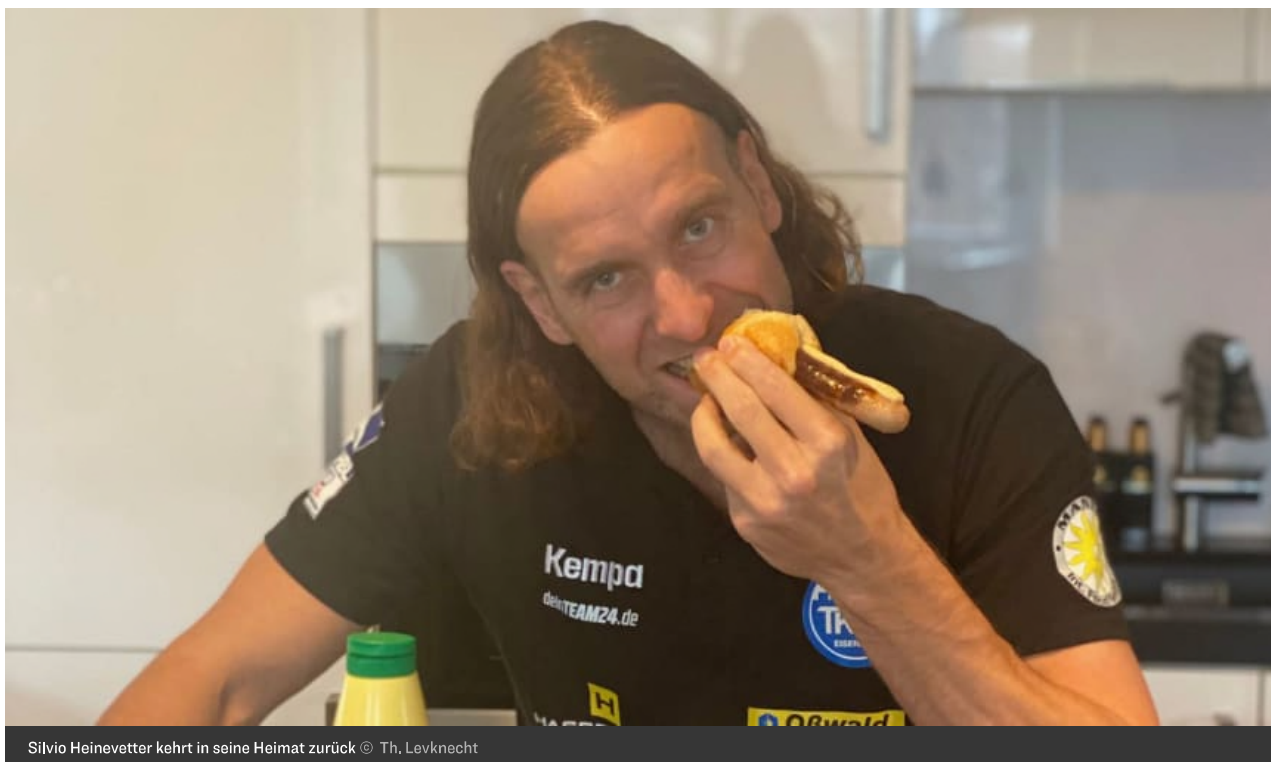
Silvio Heinevetter kehrt in seine Heimat zurück

Dieser Wechsel sorgt in der Handball-Bundesliga für Aufsehen. Silvio Heinevetter spielt ab Sommer für den ThSV Eisenach. Gegenüber handball-world spricht er nun erstmals über seine Gründe für den Transfer.